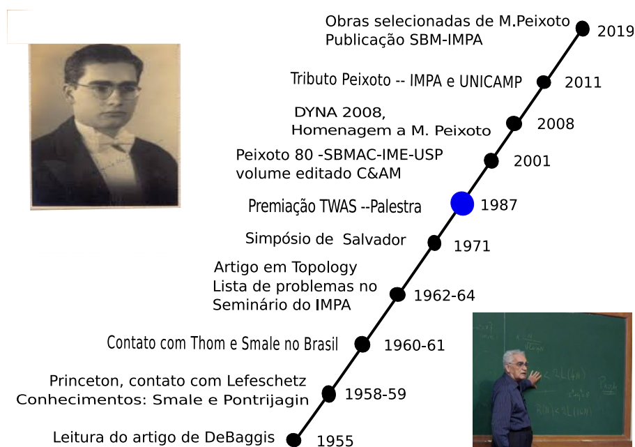
FIGURA 1. Alguns marcos de referência, sucintamente discutidos neste artigo, para o trabalho de M. Peixoto. Ver 3.3. Anos das fotos: superior 1936, inferior 2010.

sua exatidão matemática 2 . Acreditamos que a sua leitura transmite uma ideia viva de parte da sua contribuição que abrange de 1955 até 1987.